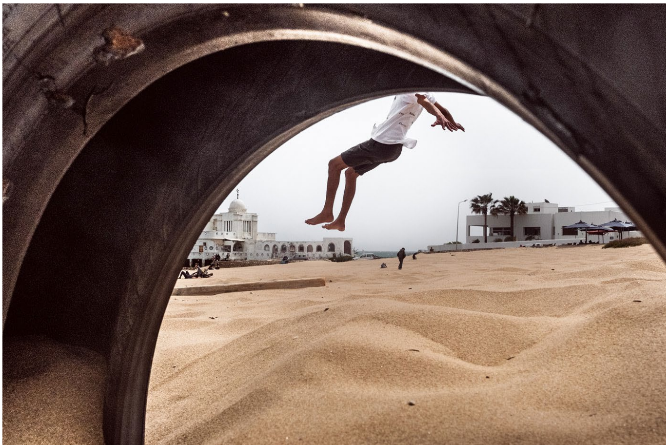
"Daily superstars".

Grâce au partenariat scientifique et documentaire entre la Maison méditerranéenne des Sciences de l'homme (MMSH) à Aix-en-Provence et les Archives Nationales de Tunisie , une édition numérique du Bulletin économique et social de la Tunisie (1946-1955) a vu le jour. Également en partenariat avec la MMSH, nous avons procédé à la publication sous forme interactive et multimédia de l'Atlas archéologique de la Tunisie .